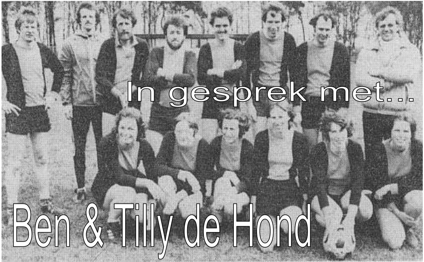
Teamfoto van het DKOD team dat destijds met 2-7 van VES won