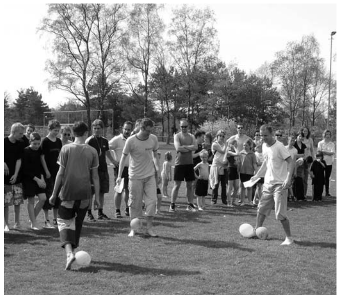
Een foto van het finalespel aan het einde van de bijzonder leuke, zonnige en zeer geslaagde jubileumsporthag!!!