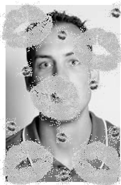
de lippenstift vermoedelijk van Alberdine :-)