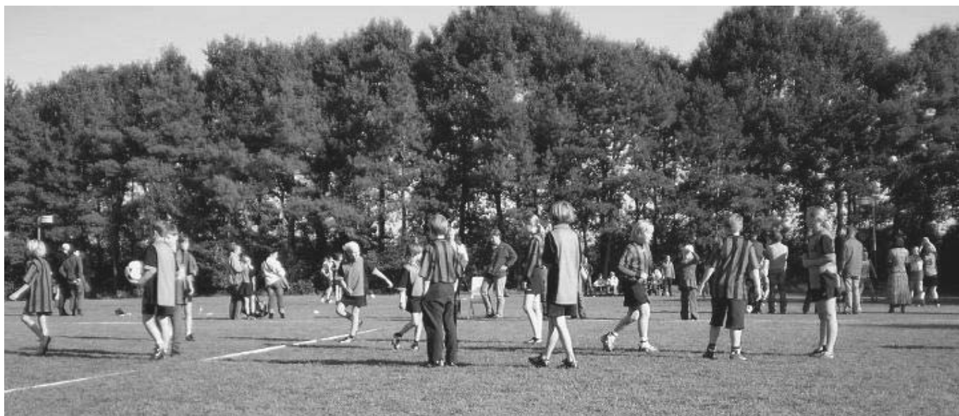
DKOD D3 in actie, oktober 2007