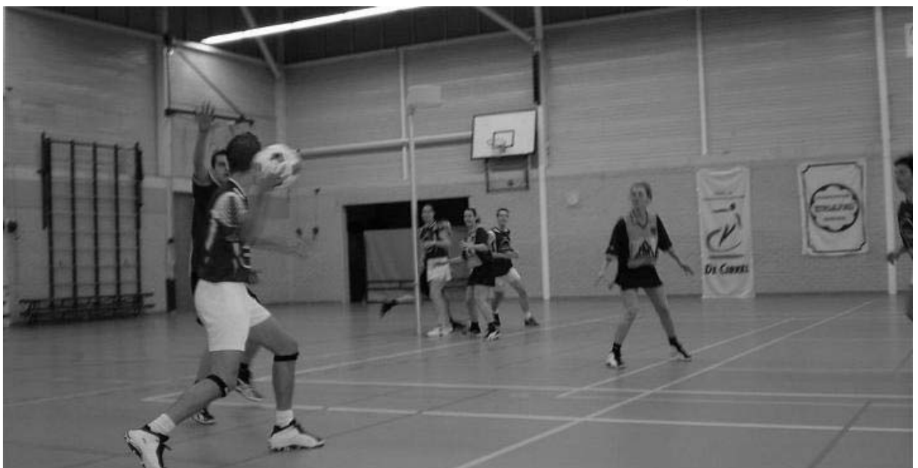
DKOD 1 in actie, 25 november 2007