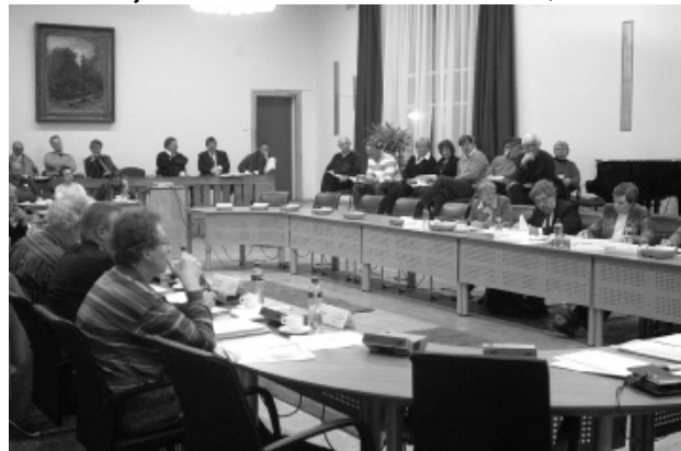
Bijeenkomst Commissie Inwoners, 11-02-08