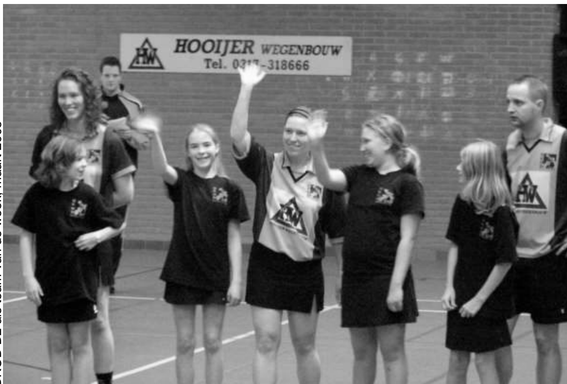
DKOD D2 als team van de week, maart 2008

Meer foto's bekijken? Check de website www.dkod.nl