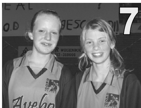
D1, de doelpunten machine