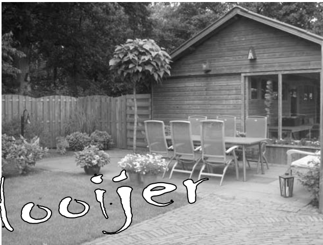
Foto 3, De tuin, het onderhoud is ook een heerlijke ontspanning voor mij, je kunt je gedachten lekker de vrije loop laten en je hebt altijd eer van je werk. En als hij dan weer schoon is, is het heerlijk vertoeven op z'n tijd.

Foto 2, Mijn spijkerjasje, daar leef ik in, hij is bijna tot op de draad versleten en zal met weemoed straks afscheid van hem moeten nemen.