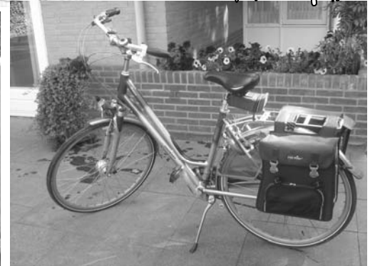
Foto 4, Dit is mijn fiets waar ik menig kilometer tje op weg trap, soms alleen in gebruik om boodschappen te doen maar het liefst ga ik samen met Karel de vrije natuur in.